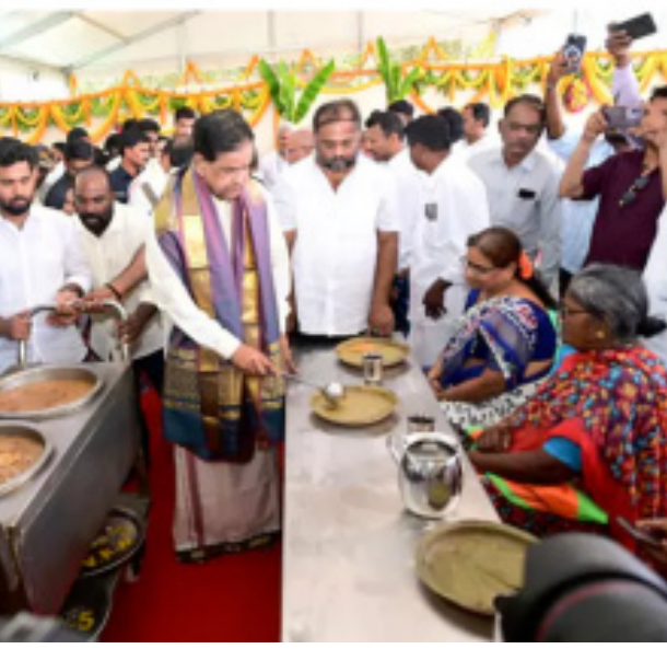
అత్యంత వైభంగా నిర్వహించేందుకు ఏర్పాట్లు చేస్తున్నట్లు ఆలయ ఛైర్మన్ తెలిపారు.